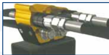
Połączenie przewodów zakończonych kompatybilnymi szybkozłaczami ISO 16028 bezpośrednio z częścią wielozłacza