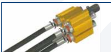
System łączenia WEO zapobiegający skręcaniu się przewodów w trakcie pracy