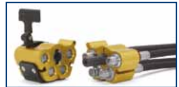
Model: Multi-X Quattro