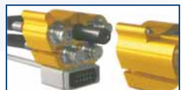
Model: Multi-X Quattro z przyłączem do przewodów elektrycznych