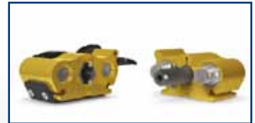
Model: Multi-X Duo